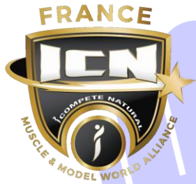
FIGURE CLASSIQUE 2025