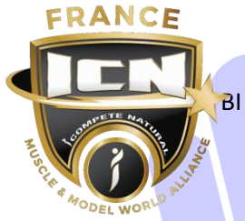
FIGURE CLASSIQUE 2025